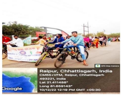
Raipur, Chhattisgarh, India CM85+VFM, Raipur, Chhattisgarh 493221, India Lat 21.411488° Long 81.669143° 10/12/22 12:19 PM GMT +05:30