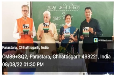
Parastara, Chhattisgarh, India CM89+3Q2, Parastara, Chhattisgarh 493221, India 08/08/22 01:30 PM