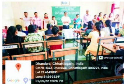
Dharsiwā, Chhattisgarh, India CM79+XQJ, Dharsiwā, Chhattisgarh 493221, India Lat 21.414989° Long 81.669324° 02/09/22 12:26 PM