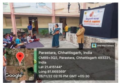
Parastara, Chhattisgarh, India CM89+3Q2, Parastara, Chhattisgarh 493221, India Lat 21.415144° Long 81.669369° 26/11/22 02:15 PM GMT +05:30